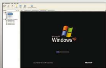
Unterstützung unterschiedlicher VDI-Lösungsanbieter